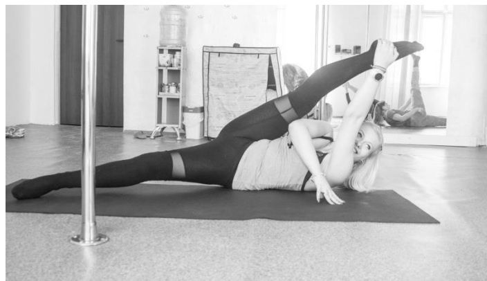
Крок вбік добре розвивається в процесі партерної гімнастики