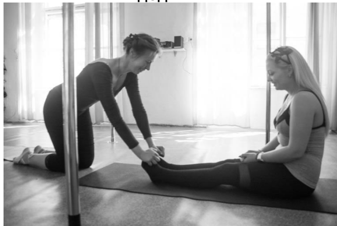
Розтяжка стопи сприяє поліпшенню кровообігу у нижніх кінцівках та готує їх до танцювальних рухів