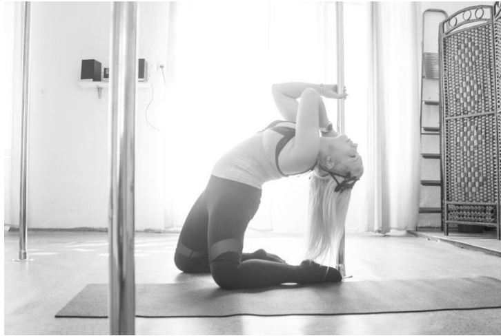
Вправи на гнучкість біля пілону слід виконувати спочатку з допомогою тренера, а потім самостійно